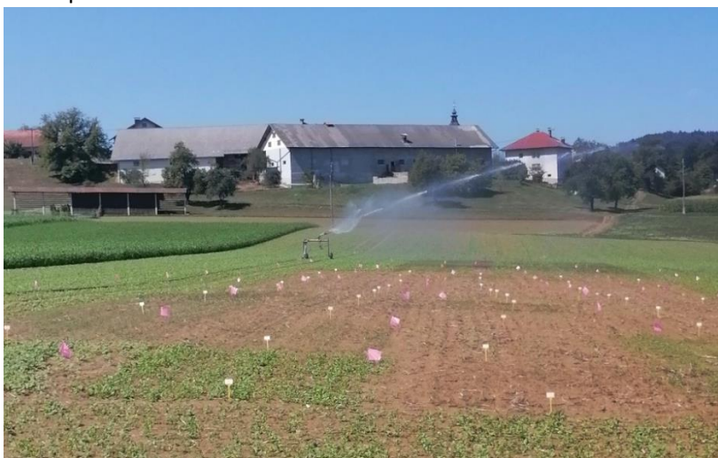
Namakanje poskusa dne 17.8. 2022