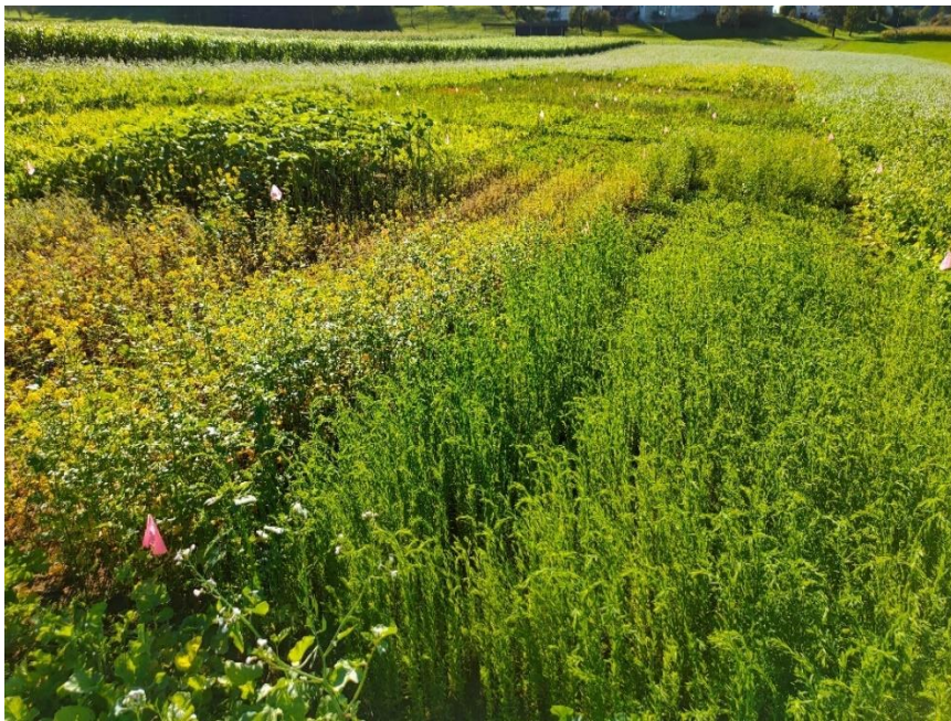
Stanje na poskusu dne 23. 9. 2022