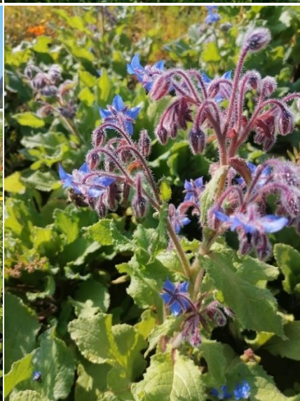
Cvetoče vrste prekrivnih dosevkov v začetku oktobra (11.10. 2022)