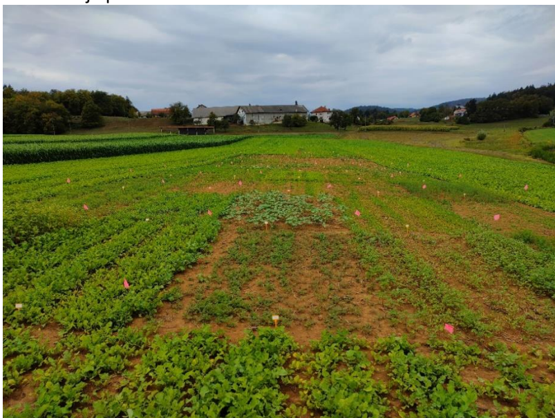
Stanje dosevkov mesec dni po setvi (31. 8. 2022)