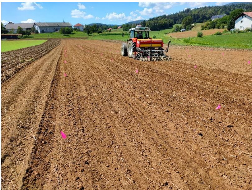
Setev poskusa dne 3.8. 2022