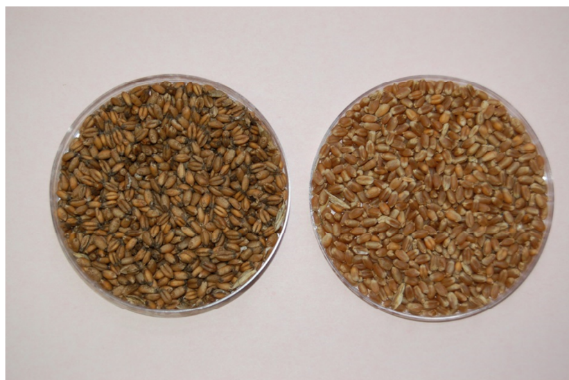
Slika 1: Močno snetljivo zrnje je temno in smrdi

Gospodarski pomen pšeničnih trdih sneti je bil v preteklosti zelo velik, z do 50 % izgubami pridelka. V razvitih delih sveta se je po vpeljavi učinkovitih kemičnih fungicidov za tretiranje semena pomen sneti zelo zmanjšal. Najpogosteje je gostitelj pšenica, možne so tudi okužbe pire, enozrnice in dvozrnice. Rž, tritikala in druge vrste trav so v naravi le redko okužene. Pojavlja se tudi na nekaterih vrstah trav. Ker razvoju sneti ustrezajo hladnejše razmere in bolj vlažna tla, je ozimna pšenica bolj ogrožena od jare. Močno snetljivo zrnje je temne barve (slika 1) in ima neprijeten vonj, zato ni uporabno za prehrano ljudi in tudi ne za živalsko krmo.