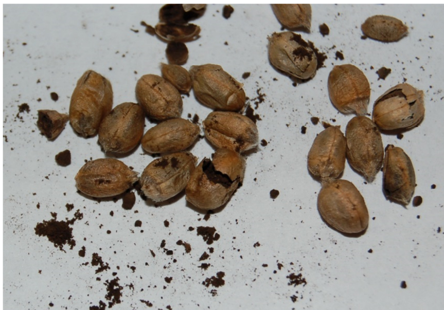
Slika 3: Snetljivo zrno je v notranjosti spremenjeno v temno gmoto spor