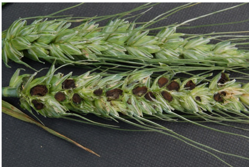
Slika 2: Prerez snetljivega klasa pšenice v zgodnji voščeni zrelosti

Ob žetvi se okužena zrna zdrobijo v prah in kontaminirajo tudi zrnje sicer zdravih rastlin, ki je ob večji količini spor temnejše in zaznaven je značilen vonj. Ti dve lastnosti sta tudi kriterij za zavrnitev požetega zrnja pri odkupu pšenice.