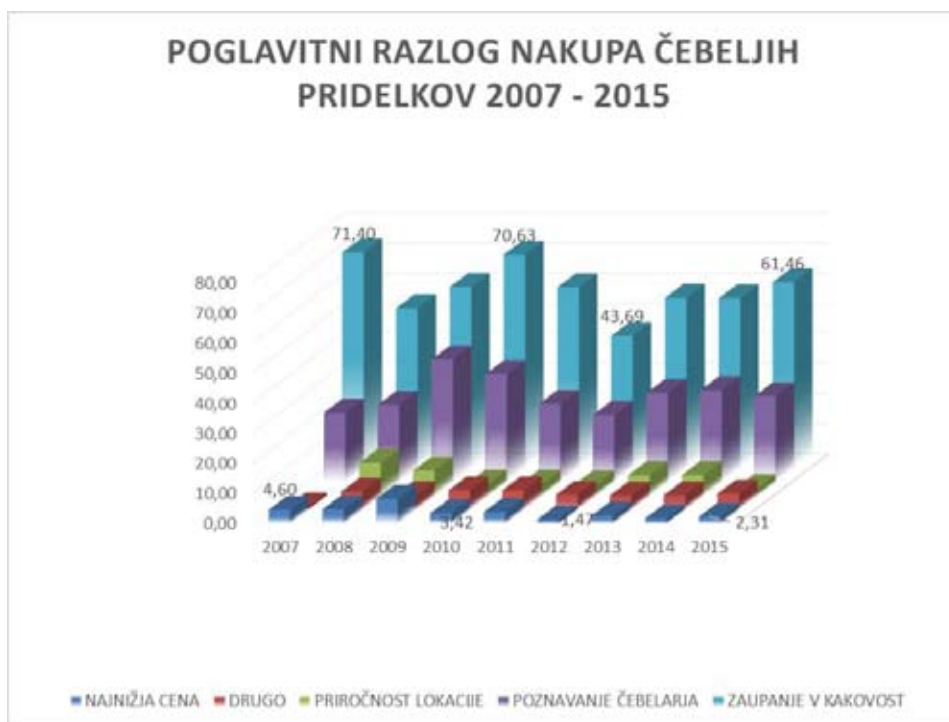
Slika 1: Poglaviti razlog nakupa čebeljih pridelkov 2007 – 2015.

Slovenski potrošniki so na podlagi izsledkov najnovejših raziskav razdeljeni v dve večji skupini - prvi so ob nakupu najprej pozorni na ceno, drugi raje kupujejo slovenske izdelke ne glede na ceno oziroma jim kakovost izdelka pomeni največ. Dobra polovica vseh vprašanih v raziskavi