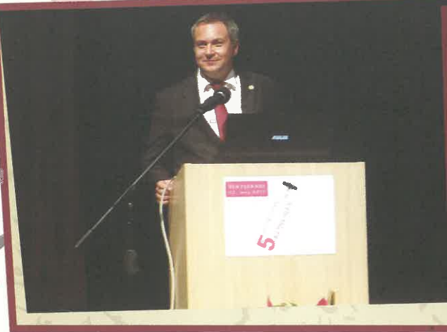
Nagovor ministra za kmetijstvo Dejana Židana.