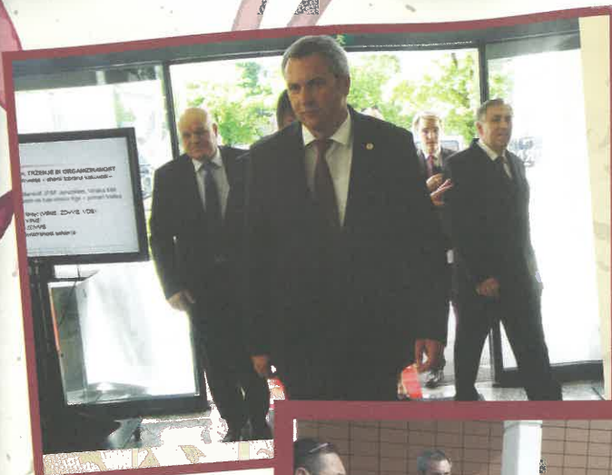
Prihod ministra in sekretarke.