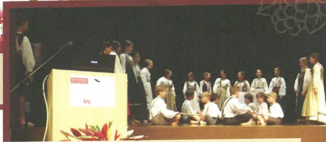
Na srečanju z novinarji v zeleni dvorani.