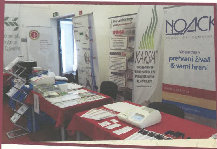
Poster – sekcija v rdeči dvorani.

V večernih urah je potekala prireditev Vina in kulinarika vinorodne dežele Posavje, na kateri so predstavili 85 dolenskih, belokranjskih in bizeljsko-sremiških vin. V kulturnem sporedu so nastopili skupina Prava banda, Šentjernejski oktet ter maskota petelin. Zaslišal se je tudi svečani razglas avstro-ogrskega kmetijskega ministrstva iz leta 1895, ki se glasi: