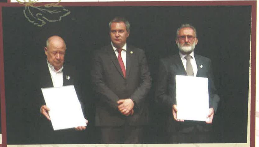
Nagrajenca ob ministru.