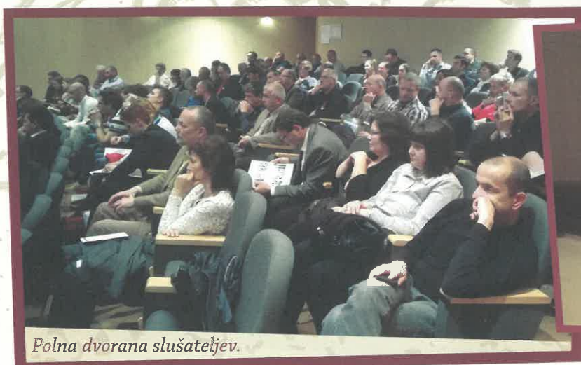
Polna dvorana slušateljev.