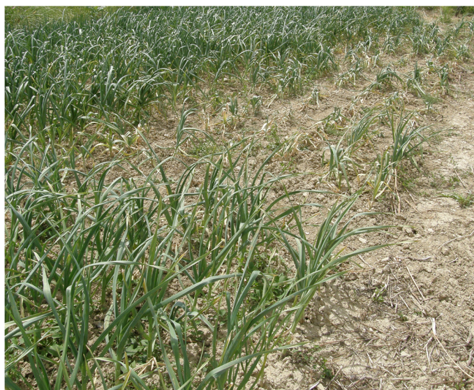
Napad ogorčic na posevku česna.

Oploditev, izleganje jajčec in celoten razvoj ogorčic poteka v rastlinskem tkivu. Razvoj D. dipsaci je odvisen od temperature. Samice začnejo izlegati jajčeca že med 1°C in 5°C, optimalne temperature za izleganje jajčec pa so med 13 in 18°C. Izleganje se preneha pri temperaturi 36°C. Samice izležejo med 200 in 500 jajčec. Največja aktivnost in največja agresivnost stebelnih ogorčic je med 10 in 20°C. Celoten razvoj D. dipsaci traja na čebuli 17 do 23 dni pri temperaturah med 13 in 22°C. V rastlinskem tkivu gostiteljskih rastlin se lahko razvije več zaporednih generacij, razvoj pa je lahko prekinjen v četrtem larvalnem stadiju. V vrsti D. dipsaci poznamo več različnih bio-ras, ki se razlikujejo po različnih gostiteljskih krogih. Različne bio-rase imajo tudi skupne gostitelje, nekatere pa so sposobne tudi medsebojnega križanja, zato je še vedno določanje bio-ras nezanesljivo. V splošnem velja da je gostiteljski krog bio-rase » Alium « omejen na čebulo, česen, druge vrste čebulnic rodu Alium , fižol, grah, bob, sojo in peso. Bio-rasa » Chicorium « pa napada: radič, špinačo, motovilec, endivijo, solato, česen pa je slab gostitelj za to bio-raso.