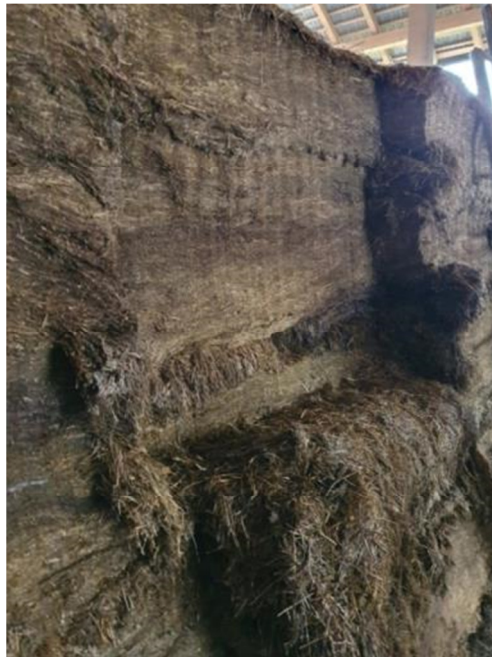
Slika 5: Odvzem silaže iz silosa mora biti urejen tako, da ostane površina silaže nezrahljana.

Z namenom izboljšanja obstojnosti silaž na zraku se lahko pri siliranju uporablja tudi silirne dodatke na osnovi heterofermentativnih mlečnokislinskih bakterij vrste Lactobacillus buchneri . Te mlečnokislinske bakterije prevrevajo mlečno kislino v očetno kislino in 1,2 propandiol. To je z vidika izpustov NMVOC-ov neugodno. Manj znano je, da ti isti dodatki zmanjšujejo vsebnost etanola v silaži, kar je z vidika izpustov ugodno. Sklenemo lahko, da silirni dodatki na osnovi bakterij Lactobacillus buchneri , kljub povečanju vsebnosti očetne kisline, ne vplivajo na vsebnosti NMVOC-ov v silaži.