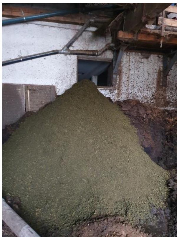
Slika 9: Nekateri kmetje pred gnojenjem gnojevko separirajo. Pri tem dobijo trdni del (separat), ki vsebuje relativno malo NMVOC in redko gnojevko, ki se pri gnojenju hitro vpije v tla. Z vidika izpustov NMVOC je to ugodno.

Več o možnostih za zmanjšanje izhlapevanja snovi pri gnojenju z živinskimi gnojili je napisano v Svetovalnem kodeksu dobrih kmetijskih praks za zmanjševanje izpustov amonijaka (Verbič, 2020 17 ).