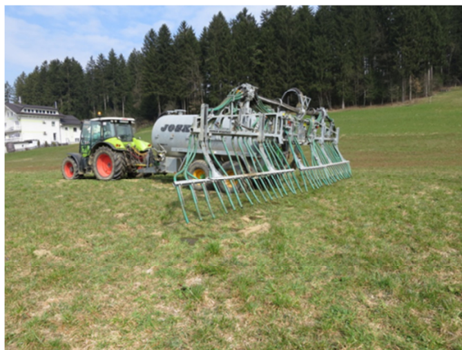
Slika 8: Pri gnojenju z vlečenimi cevmi zmanjšamo površino gnojevke, iz katere izhlapevajo NMVOC-i.