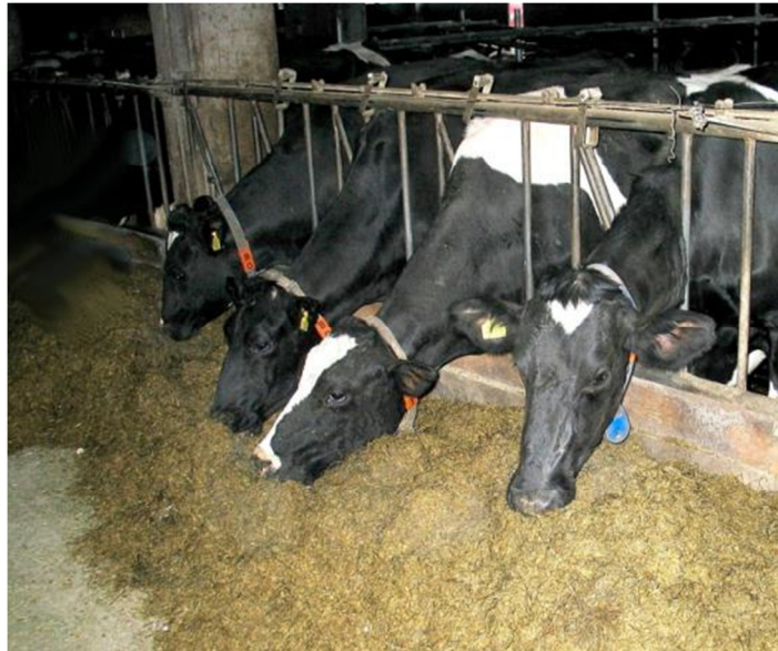
Slika 6: Izpusti NMVOC-ov pri krmljenju silaže presegajo izpuste iz silosov. Silažo mora biti porazdeljena po krmilni mizi tako, da je izhlapevanju izpostavljena čim manjša površina.