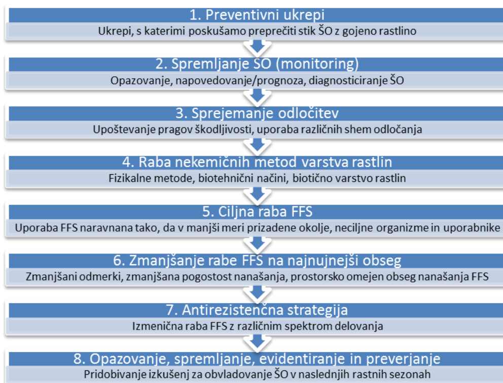
Slika 2: Temeljna načela integriranega varstva rastlin