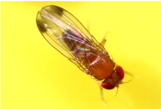
Slika 2: Drosophila suzukii - samec v mirovanju (n.v. 2,0-3,5 mm)