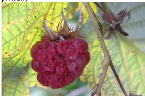
Slika 9: Napaden plod maline