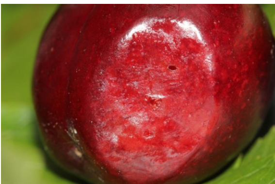
Slika 8: Poškodbe na plodu češnje