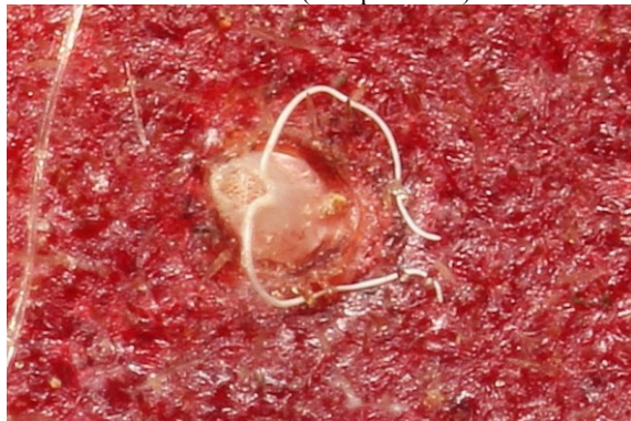
Slika 7: Jajčece odloženo pod kožico breskve (zelo povečano)