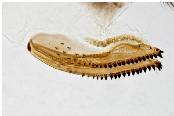
Slika 5: D. suzukii - samica: sklerotizirana mečasta leglica z močnimi in ostrimi zobci (zelo povečano).