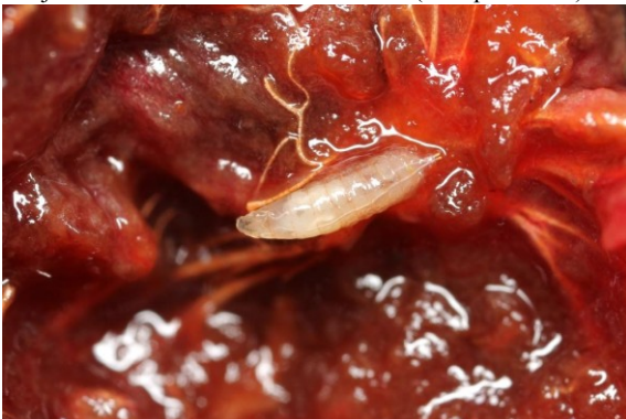
Slika 6: Žerka v plodu češnje