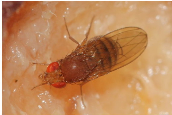
Slika 3: D. suzukii - samica (n.v. 2,5 - 4,0 mm)