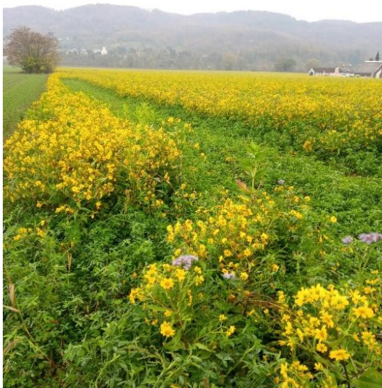
Slika 1: Cvetoči mungo v mešanici za podor v toplem delu jeseni

Če bo zemljišče v pripravi daljše obdobje ( več kot dve leti), priporočamo najprej meliorativno obdelavo, ki bo koristila tlom.