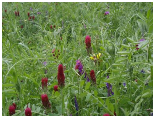
Slika 3: Mešanica grašljinka za podor

Jagodi najbolj ustrezajo srednje težka, globoka tla, s pH 5,5 – 6,5, z 2-4 % organske snovi ter s srednjo založenostjo s hranili (15-25 mg/100 g tal P 2 O 5 in 25-30 mg/100 g tal K 2 O). To je cilj, ki ga želimo doseči s predpripravo tal. V primeru, da je potrebno v tla z založnim gnojenjem vnesti velike količine hranil priporočamo, da se to izvede pred sejanjem predposevka in ne neposredno pred sajenjem jagod.