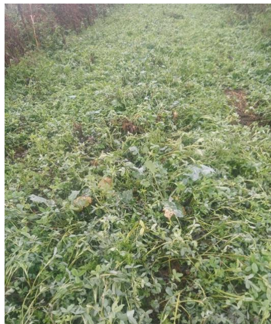
Slika 2: Mešanica za podor po prvih mrazovih

Jagodi najbolj ustrezajo srednje težka, globoka tla, s pH 5,5 – 6,5, z 2-4 % organske snovi ter s srednjo založenostjo s hranili (15-25 mg/100 g tal P 2 O 5 in 25-30 mg/100 g tal K 2 O). To je cilj, ki ga želimo doseči s predpripravo tal. V primeru, da je potrebno v tla z založnim gnojenjem vnesti velike količine hranil priporočamo, da se to izvede pred sejanjem predposevka in ne neposredno pred sajenjem jagod.