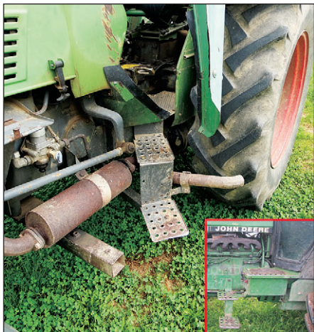
Na starejših traktorjih pogosto vidimo stopnice, ki ne bi ustrezale današnjim tehničnim zahtevam.

zlahka najde in doseže. Navpične razdalje med naslednjimi stopnicami ali klini morajo biti čim bolj enake. Vsi pripomočki za vstop in izstop morajo imeti tudi oprijemala. Ko so na traktorju pnevmatike največje velikosti, ki jo priporoča proizvajalec, ne sme biti najnižja opora za stopalo (stopnička – stopna površina) oddaljena od tal več kot 55 cm. Stopnice ali klini morajo biti oblikovani in izdelani tako, da stopalo na njih ne zdrsne. Nagib stopnic mora biti med 70 in 90 stopinjami glede na ravnino tal. Stopnice so potrebne za traktorje, kjer dno kabine presega vertikalno