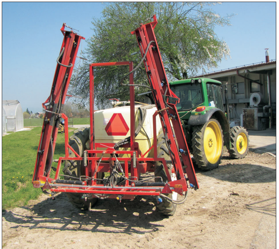
Če so počasi vozeča vozila (do 40 km/h) pravilno označena, je manjša verjetnost nalezov drugih vozil od zadaj.

V Resoluciji je tudi posebno poglavje, ki govori o voznikih traktorjev. V njem piše, da je cilj resolucije zmanjšati število voznikov traktorjev, ki umrejo ali pa so hudo poško-