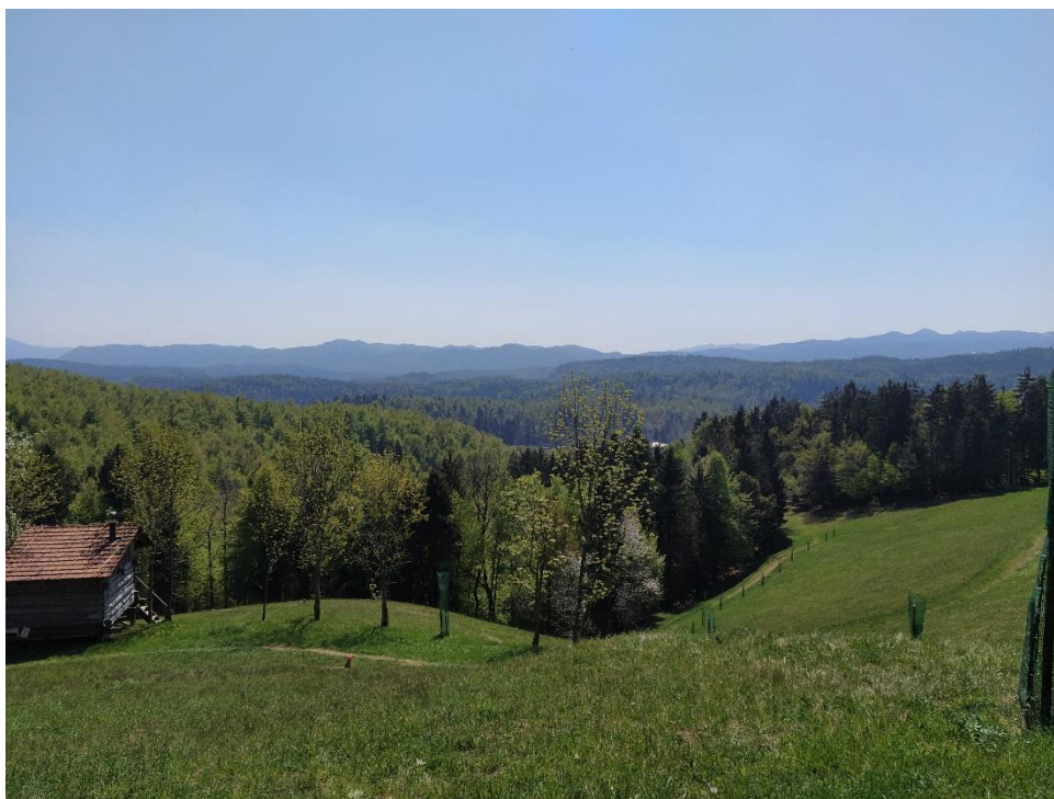
Kmetija na Zaplani, Osrednja Slovenija