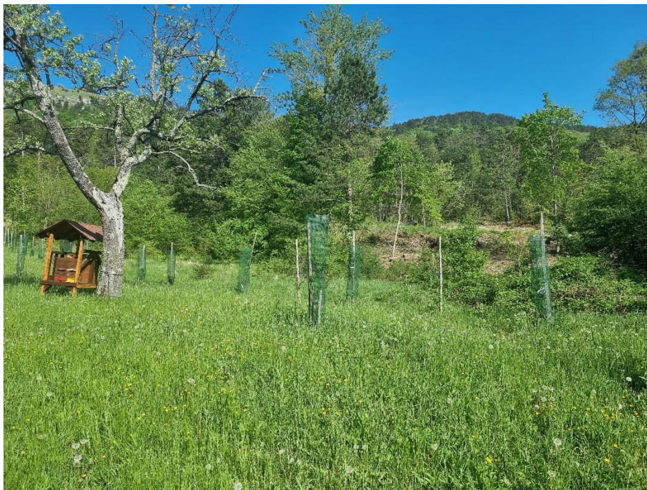
Turistična kmetija Pri Andrejevih, Krajinski park Pivška presihajoča jezera