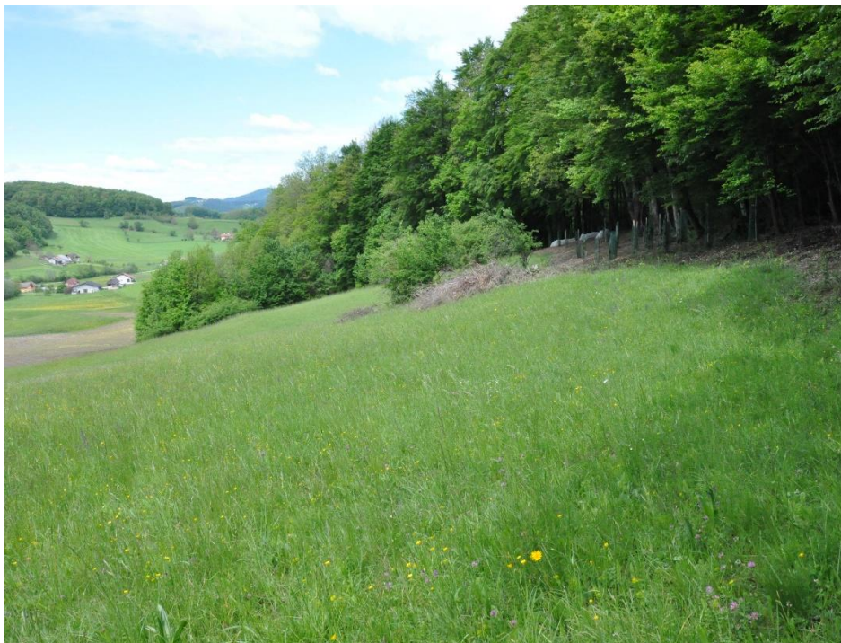
Kmetija Vertovšek, obrobje Kozjanskega