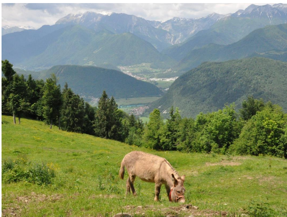
Turistična kmetija Široko, Zgornja Soška dolina